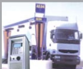
автомат HECFLEET Коммерческие АЗС