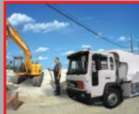
автомат ТА 2331 MOBIL Мобильные АЗС