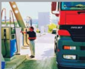
Автомат ТА 2331 Ведомственные АЗС